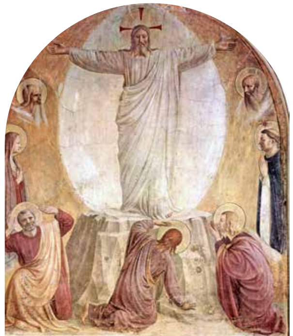
Transfiguración, por Bl. Fra Angelico.

La buena noticia es que Jesús murió en la cruz para salvarnos del pecado. Él nos invita a amarlo y aceptar su regalo de salvación.